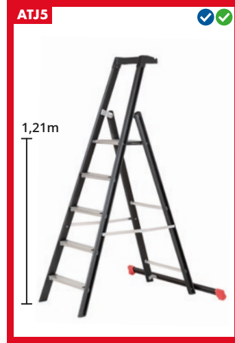
Sis. vaakatuki 1x1,1m