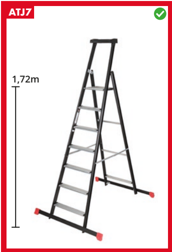
Sis. vaakatuet 2x1,1m