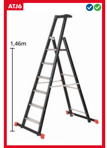
Sis. vaakatuet 2x0,9m