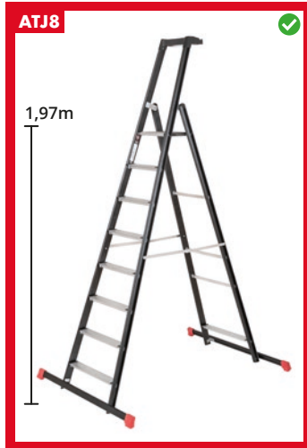
Sis. vaakatuet 2x1,2m